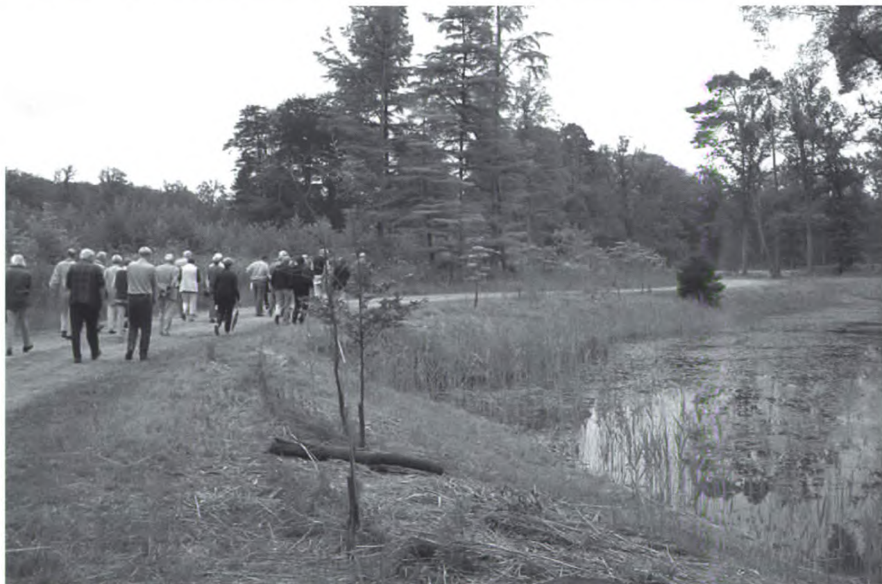
Op de Twickeldag konden de leden ook een wandeling maken over de Breede Riet.

Door de vele problemen die het op tijd verschijnen van het Twickelblad steeds opleverde, is de redactie overgestapt op een andere drukker. Dit betekende wel een