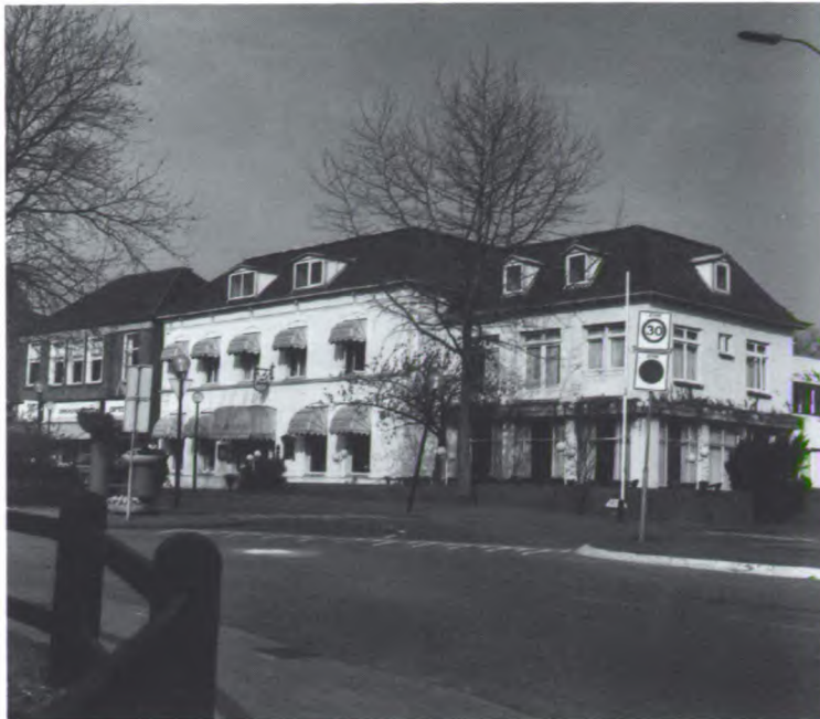
Hotel De Zwaan markeert de rand van de oude stadskern van Delden.

Over het contact met Twickel zijn beiden zeer tevreden. “De samenwerking met Twickel is bijzonder goed te noemen. Onze ideeën over het pand en die van de rentmeester kwamen vrijwel overeen. We konden goed afspraken maken. Momenteel knapt Twickel de buiten-