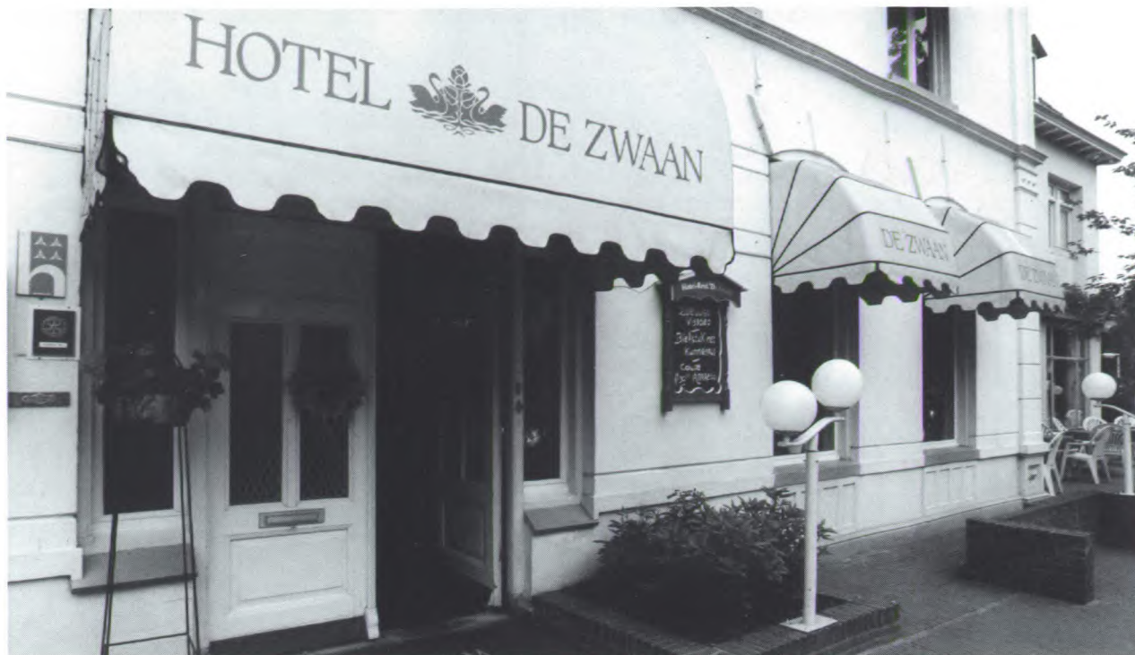
De entree van Hotel De Zwaan.

Authentiek hotel-restaurant met historische uitstraling