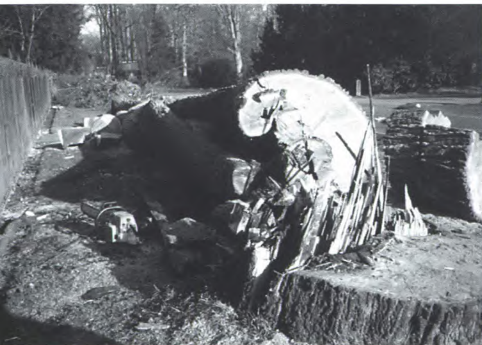
De eiken verkeerden in zeer slechte staat.

Zoals aangekondigd in het vorige nummer van het Twickelblad zijn de laatste eiken ter hoogte van het parkeerterrein geveld; inmiddels staat hier een hele serie