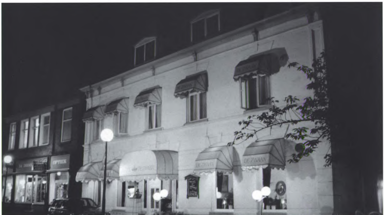
Ook 's avonds straalt Hotel De Zwaan sfeer en gezelligheid uit.