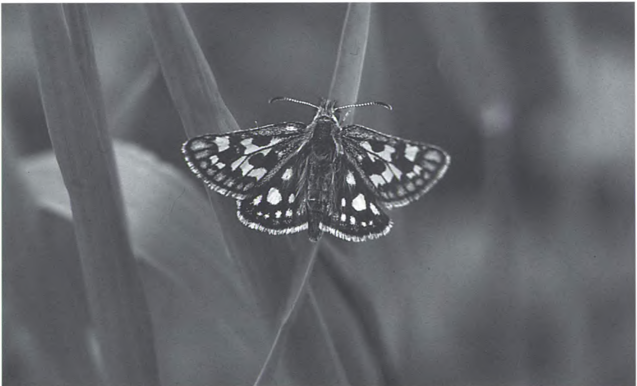
Het Bont Dikkopje.

De route loopt van zuidoost naar noordwest en is grotendeels open aan de linkerzijde. Bomen aan de rechterzijde bieden gedeeltelijke beschutting. De laatste twee transecten kennen een tweezijdige beschutting. Dit betekent: minder invloed van de wind en koelte op warme zomerdagen.