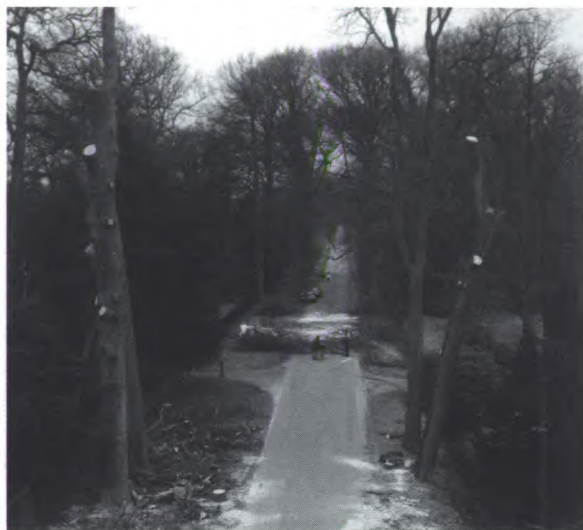
Een laatste blik op de bomen.

veelbelovende jonge eikjes. Het vellen van de soms zeer zware eiken vlak naast de landgoedwinkel en het gietijzeren hek was geen eenvoudige klus. Met veel precisie hebben de medewerkers van de stichting de bomen zodanig geveld dat zij geen schade konden toebrengen. Op de foto's is duidelijk te zien dat de bomen soms zeer slecht waren en vaak van binnen totaal verrot.