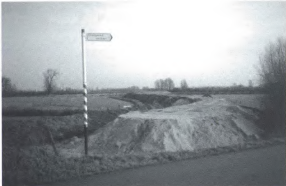
De landbouwweg die aansluit op de Doesburgsedijk, is opgeruimd.

In Dieren werd een landbouwweg die aansluit op de Doesburgsedijk, opgeruimd. Deze weg is aangelegd rond 1970. Dit gebeurde vooruitlopend op het doortrekken van de snelweg rond 1970. Aangezien dit plan van de baan is, had deze weg geen functie meer. De gemeente was bereid de weg over te dragen aan de Stichting Twickel. Dit bood de stichting de unieke mogelijkheid om een weg te verwijderen uit het landschap. Iets dat verder zelden gebeurt in deze tijd, waarin het netwerk van wegen meestal alleen maar wordt uitgebreid.