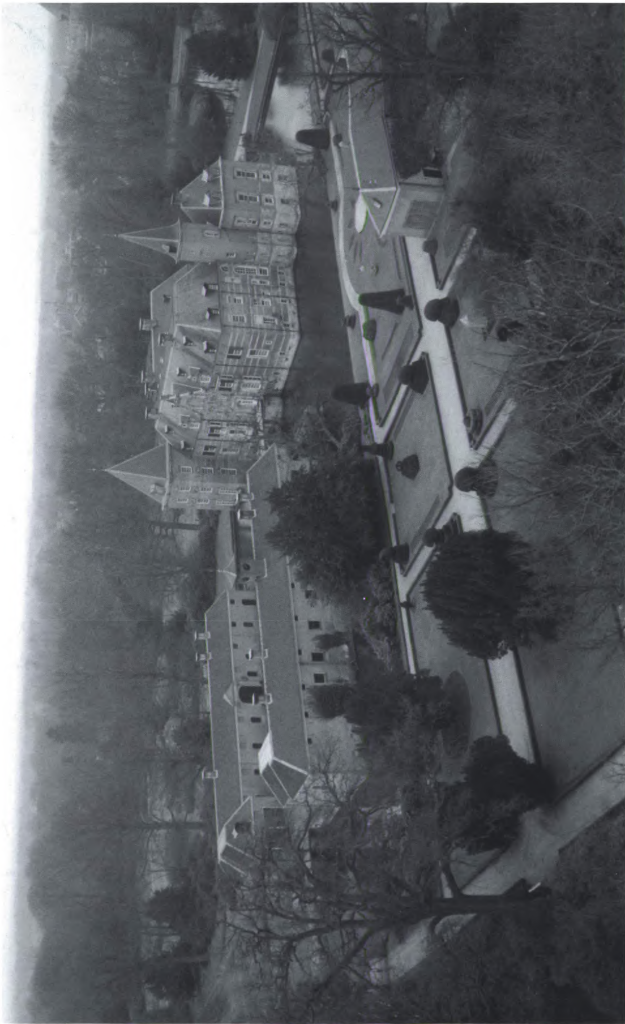
Het vellen van de eiken aan de Twickelerlaan geschiedde met inzet van een hoogwerker. Verschillende personeelsleden van Twickel maakten van deze attractie gebruik om enkele ongewone foto's te schieten.