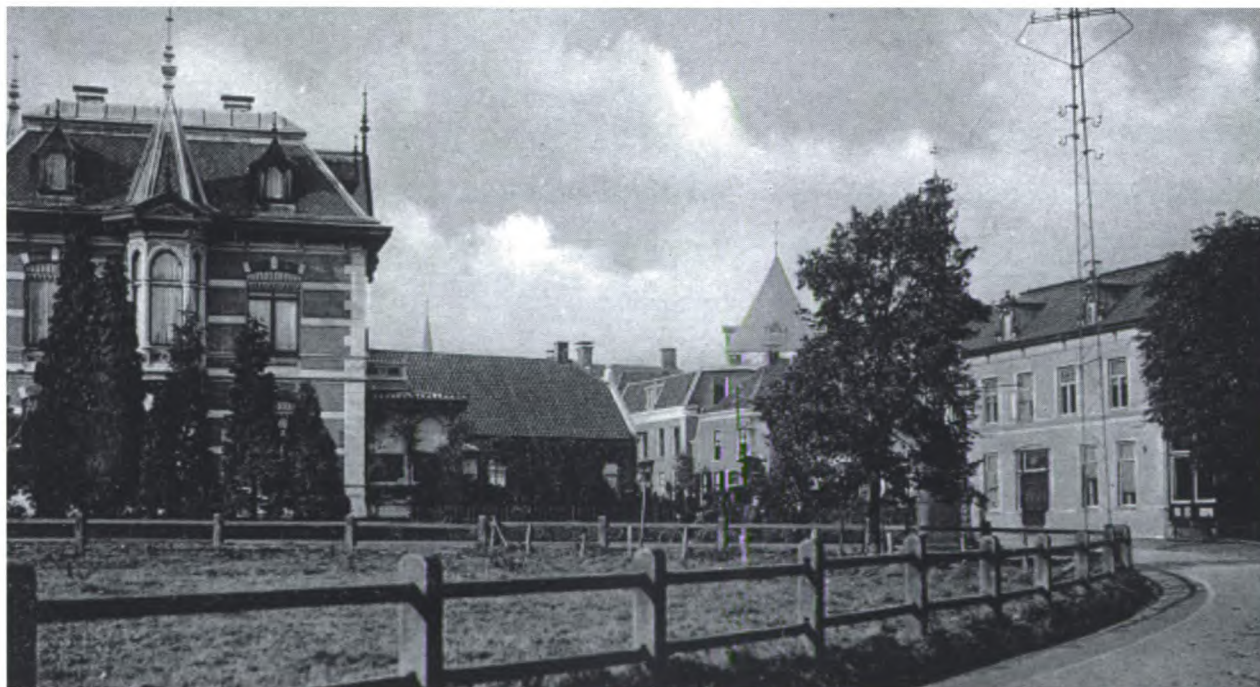
Het Hotel in vroeger dagen.

De nieuwe exploitanten hebben zich ook al verdiept in de rijke historie van De Zwaan. “We zijn hier amper een paar maanden, maar we komen langzamerhand steeds meer te weten over de rijke historie van dit gebouw. We horen van familie en gasten prachtige verhalen over hoe het vroeger was. We hebben de exacte historie nog niet kunnen uitdiepen. Waarschijnlijk maakten reizigers al in 1804 gebruik van de hotelfaciliteiten. Het pand waarin Hotel De Zwaan is gevestigd, is gebouwd in 1802.