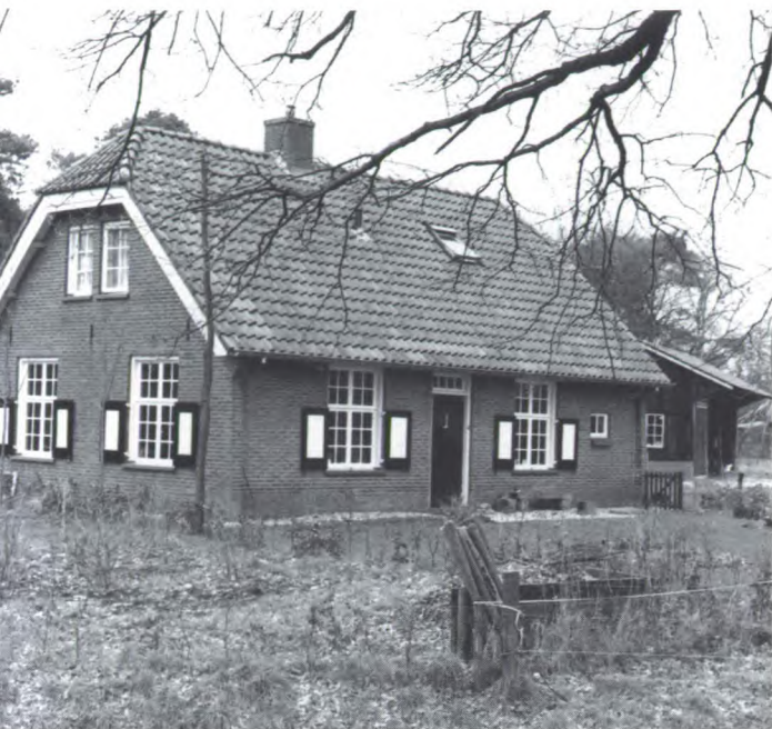
Erve De Veldmolen.

In het vorige Twickelblad zijn de resultaten van een enquête onder bewoners van Twickelpanden gepubliceerd. Inmiddels is er tussen de initiatiefnemers van de enquête en de Stichting Twickel, de voorzitter van het bestuur en de rentmeester, van gedachten gewisseld over de uitkomsten van het onderzoek. Samengevat leverde dat de volgende voorlopige conclusies op: