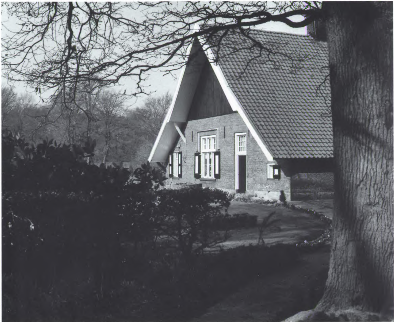
Erve Dubbelink Havezate in de buurtschap Azelo.

Landbouw in waardevolle landschappen verdient steun