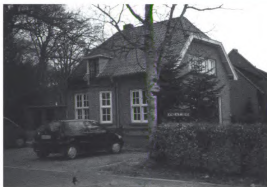
Het woonhuis in Lage.