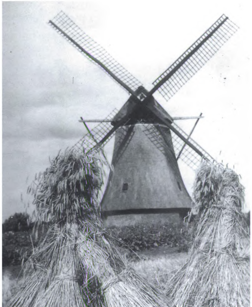
De voormalige Eschmolen stond temidden van de akkers op de Delderesch.