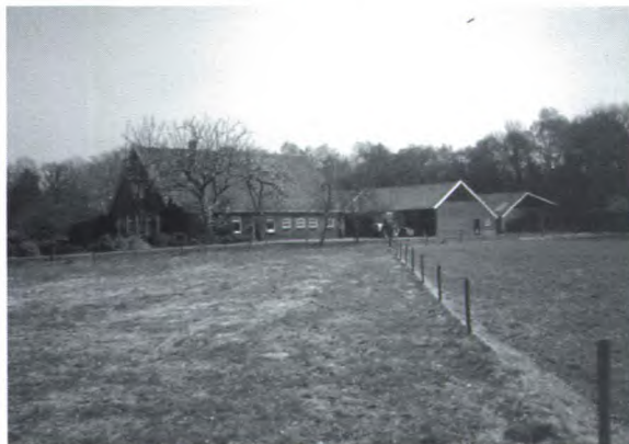
Het erve Veldsnijder.