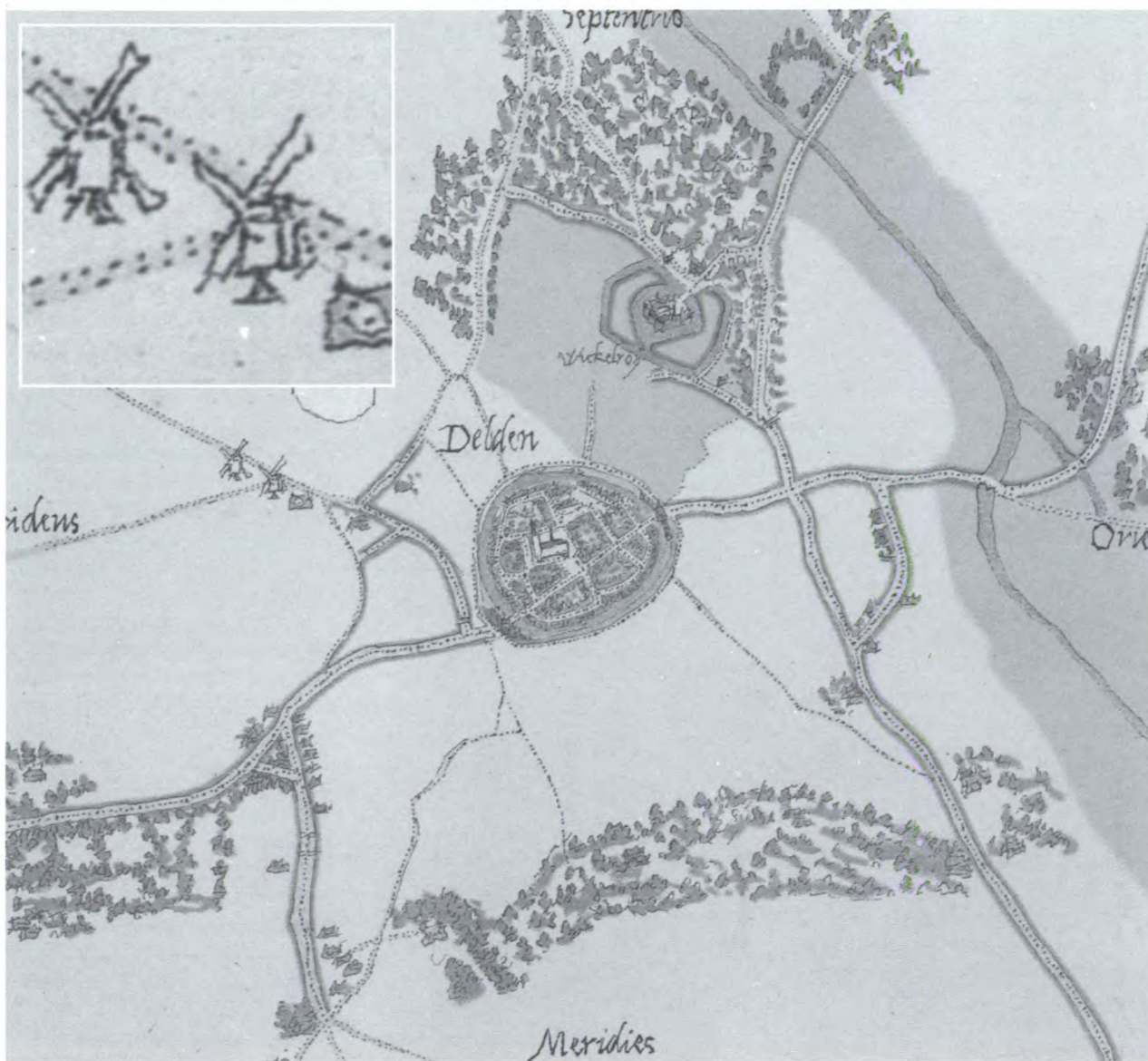
Kaart van het stadje Delden en omgeving van Jacob van Deventer, ca. 1550. Aan de westzijde van de stad staan de twee windmolens op de Deldeneresch. De weergave van de molens doet vermoeden, dat de beide windmolens stenderkastmolens zijn geweest.